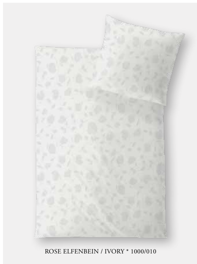
ROSE ELFENBEIN / IVORY * 1000/010