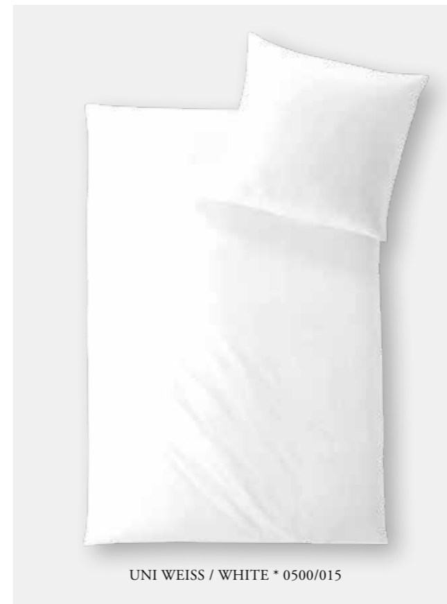
UNI WEISS / WHITE * 0500/015