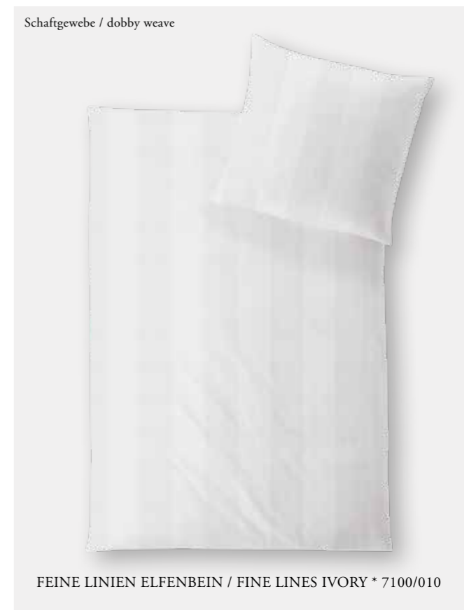
FEINE LINIEN ELFENBEIN / FINE LINES IVORY * 7100/010