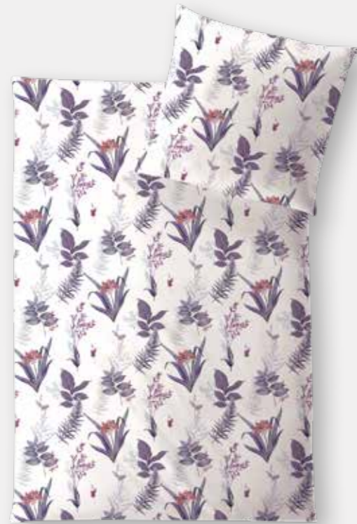
LUCCA * 3975 | Unterseite elfenbein / back side ivory