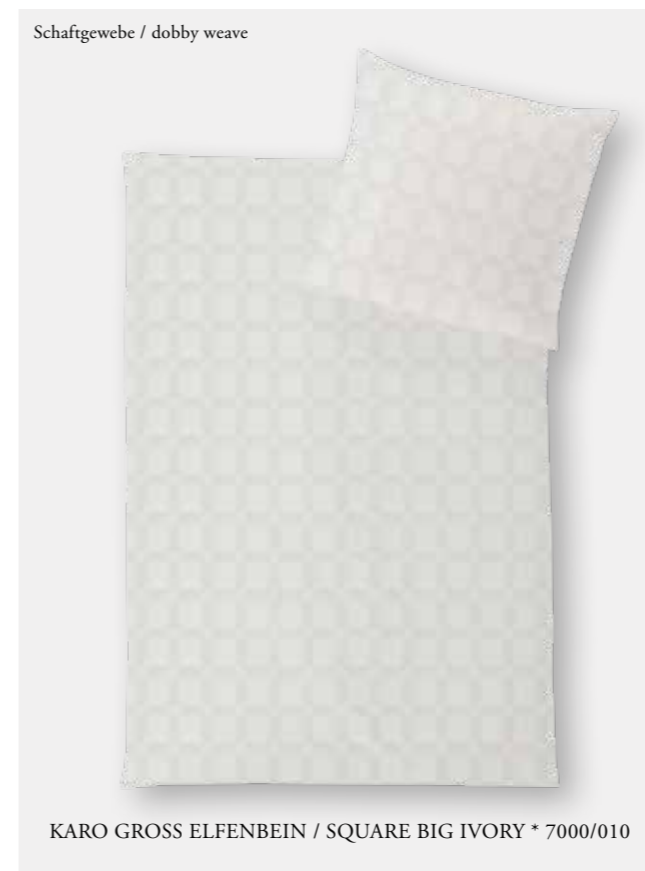
KARO GROSS ELFENBEIN / SQUARE BIG IVORY * 7000/010