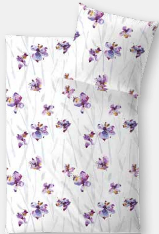
ANACAPRI * 3974 | Unterseite elfenbein / back side ivory