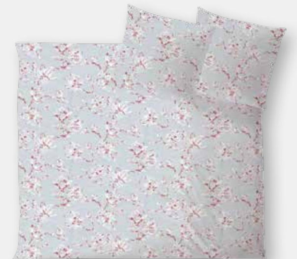
CHIANTI * 4935 | Unterseite weiß / back side white