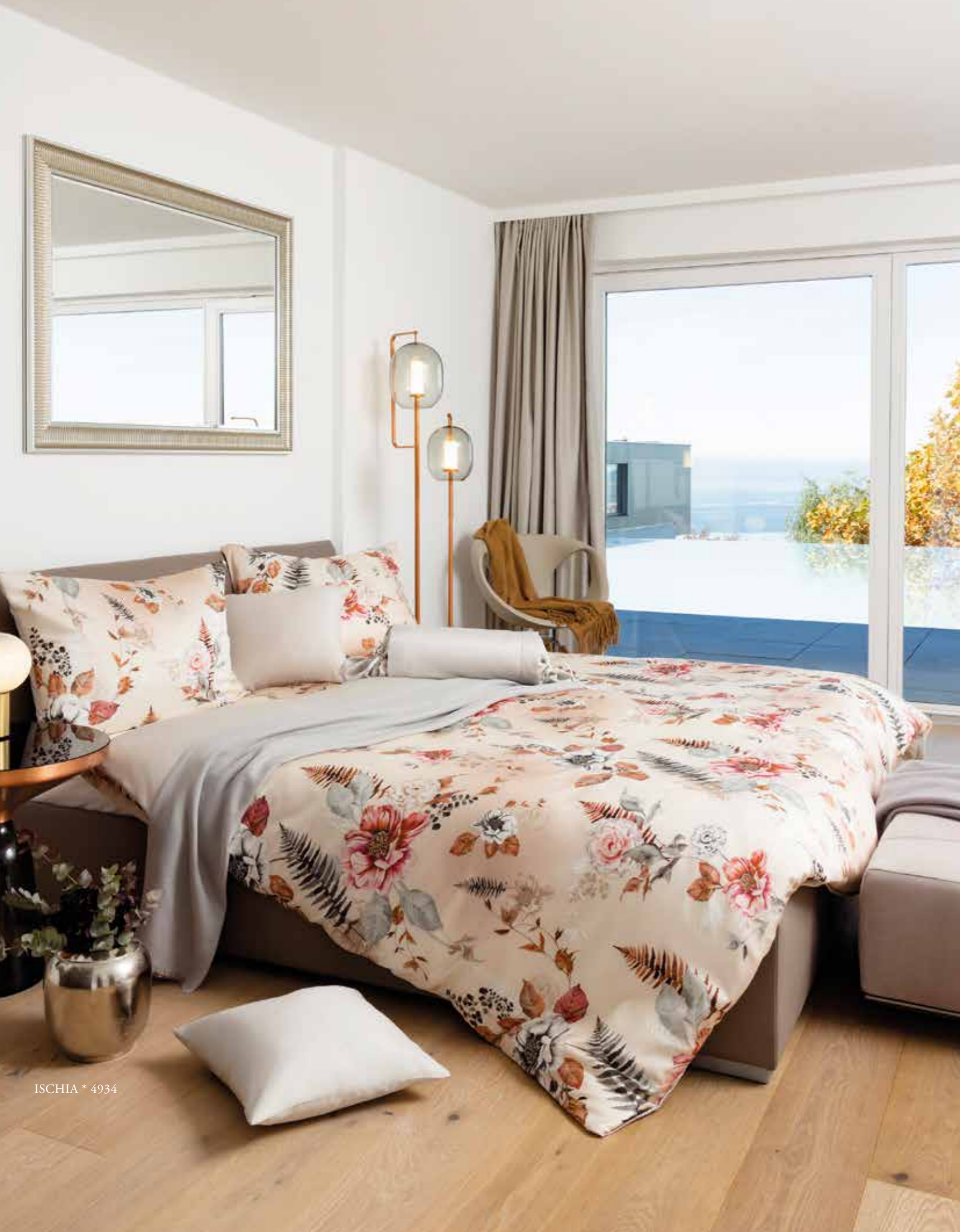
ISCHIA * 4934