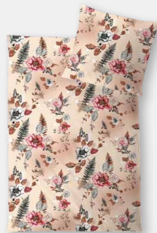
ISCHIA * 4934 | Unterseite silber / back side silver