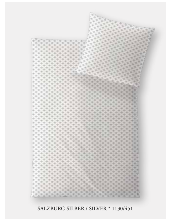
SALZBURG SILBER / SILVER * 1130/451