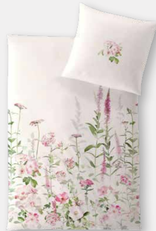
SAN REMO * 3931 | Unterseite elfenbein / back side ivory