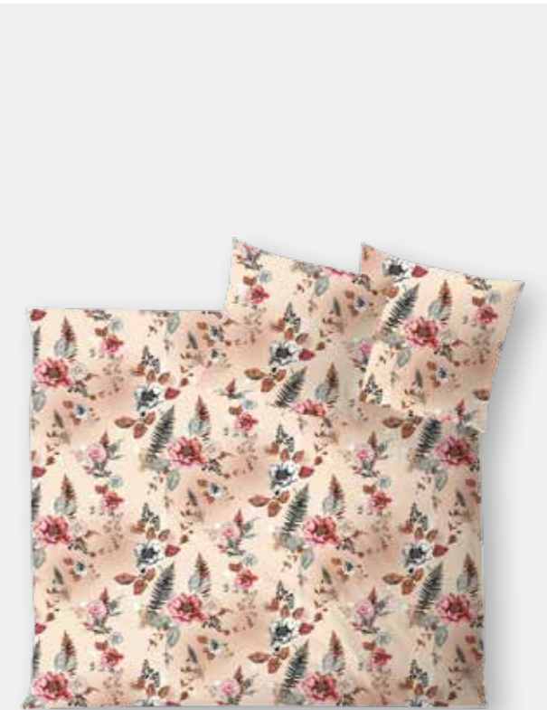
ISCHIA * 4934 | Unterseite silber / back side silver