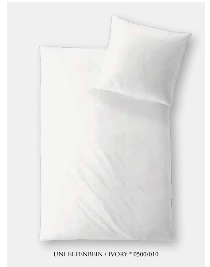
UNI ELFENBEIN / IVORY * 0500/010