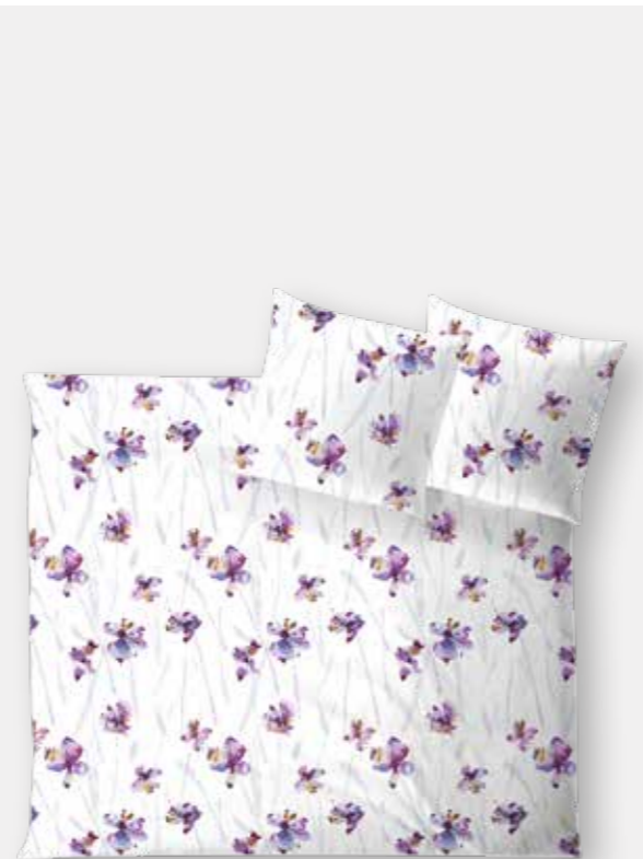
ANACAPRI * 3974 | Unterseite elfenbein / back side ivory