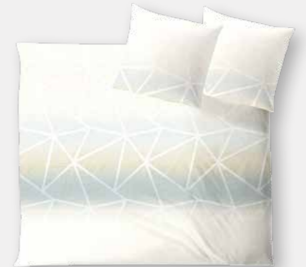
SIENA * 4974 | Unterseite elfenbein / back side ivory