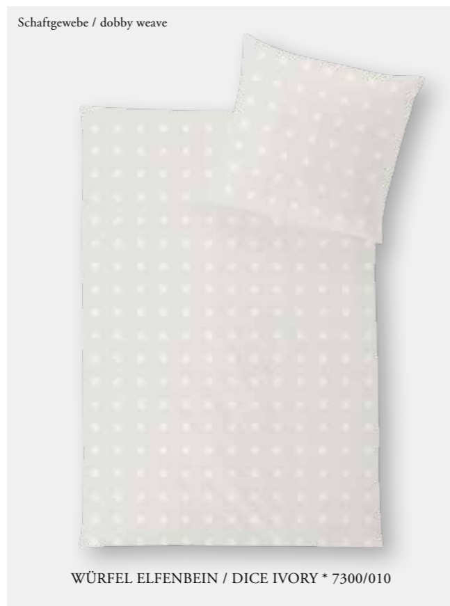
WÜRFEL ELFENBEIN / DICE IVORY * 7300/010