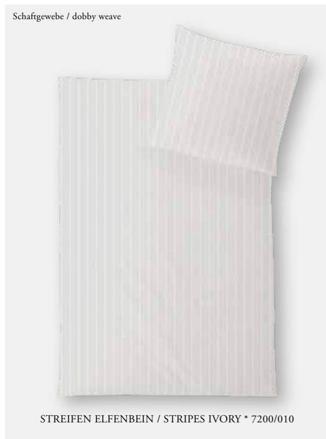
STREIFEN ELFENBEIN / STRIPES IVORY * 7200/010