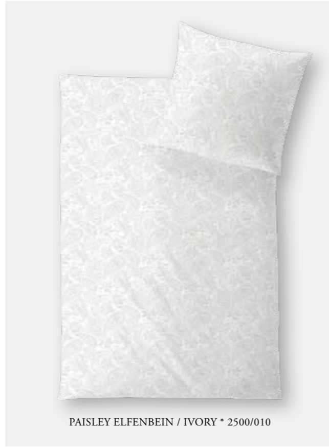
PAISLEY ELFENBEIN / IVORY * 2500/010