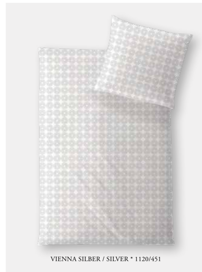
VIENNA SILBER / SILVER * 1120/451