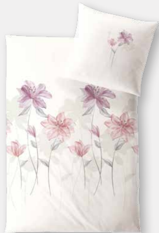
PISA * 3934 | Unterseite elfenbein / back side ivory