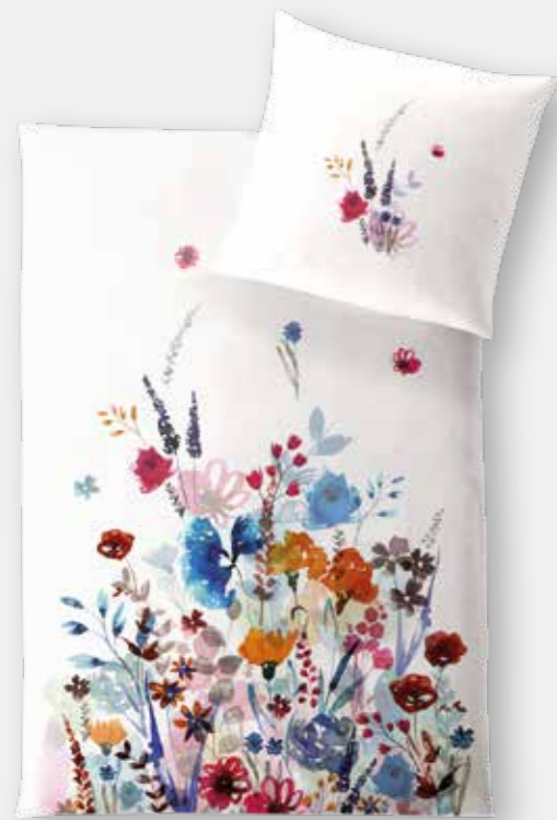
POSITANO * 5933 | Unterseite elfenbein / back side ivory