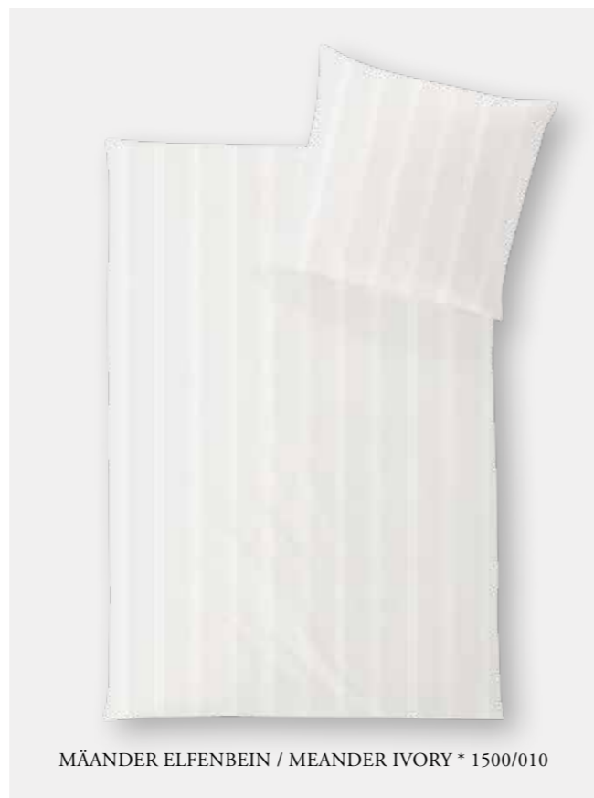
MÄANDER ELFENBEIN / MEANDER IVORY * 1500/010