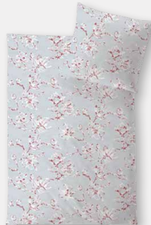
CHIANTI * 4935 | Unterseite weiß / back side white