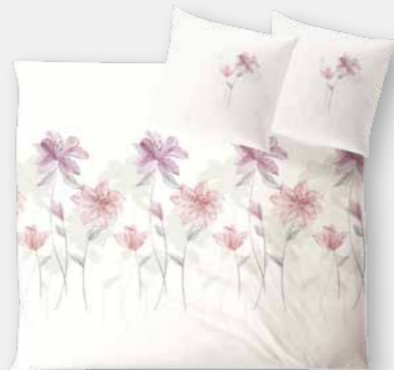
PISA * 3934 | Unterseite elfenbein / back side ivory