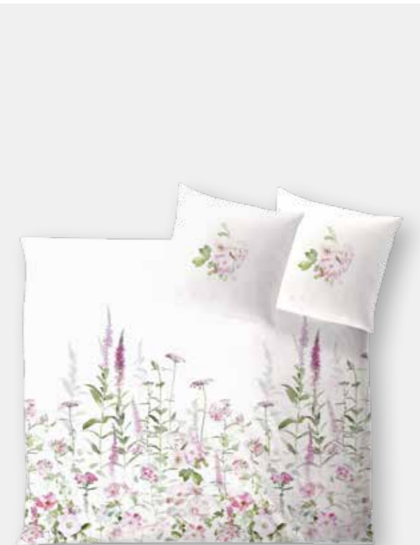
SAN REMO * 3931 | Unterseite elfenbein / back side ivory