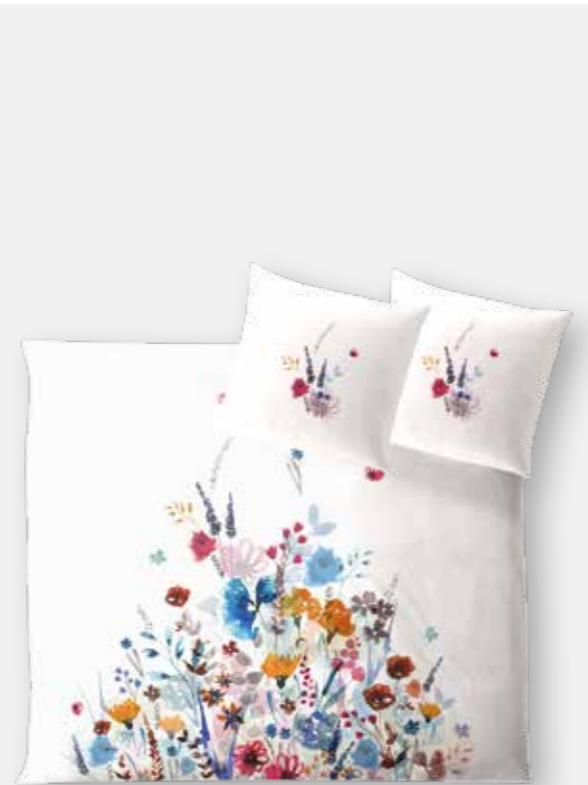
POSITANO * 5933 | Unterseite elfenbein / back side ivory