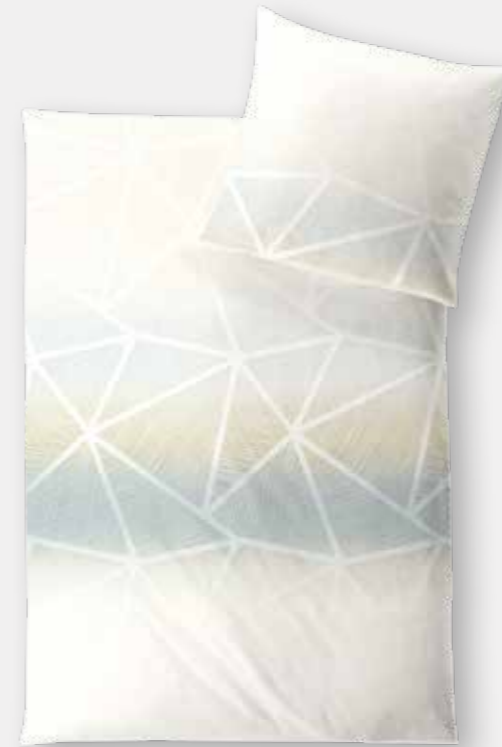
SIENA * 4974 | Unterseite elfenbein / back side ivory