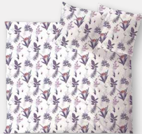
LUCCA * 3975 | Unterseite elfenbein / back side ivory